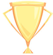
de Pokàl La coupe