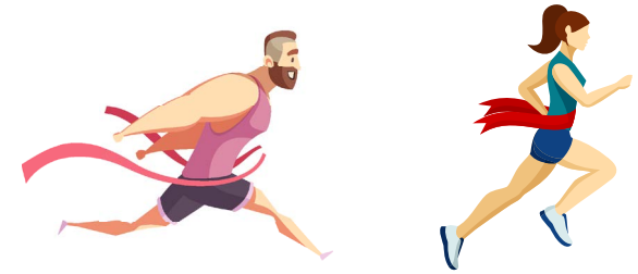
de Meischer – d'Meischtere Le champion - La championne