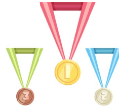
d'Medaille La médaille