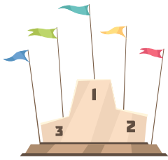
's Podascht Le podium